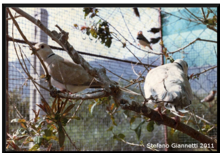
"Vecchia foto risalente alla metà degli anni 80, interno della voliera con un melograno in primo piano delle tortore sullo sfondo un paio di mandarini"

Ho sempre avuto la passione per gli uccelli, avevo circa 10 anni quando mio padre costruì una voliera in giardino, vi "alloggiavano" mandarini, tortore, quaglie e a più riprese esotici vari. Per anni, quell'aviario era un concentrato di piume e colori. Tuttavia l'inesperienza e la giovane età non mi hanno mai fatto affrontare un allevamento mirato e selettivo. Trent'anni fa internet non esisteva, e quello che oggi si può sapere in un click a quei tempi era impossibile a sapersi a meno di avere dei conoscenti già nel giro ornitologico.